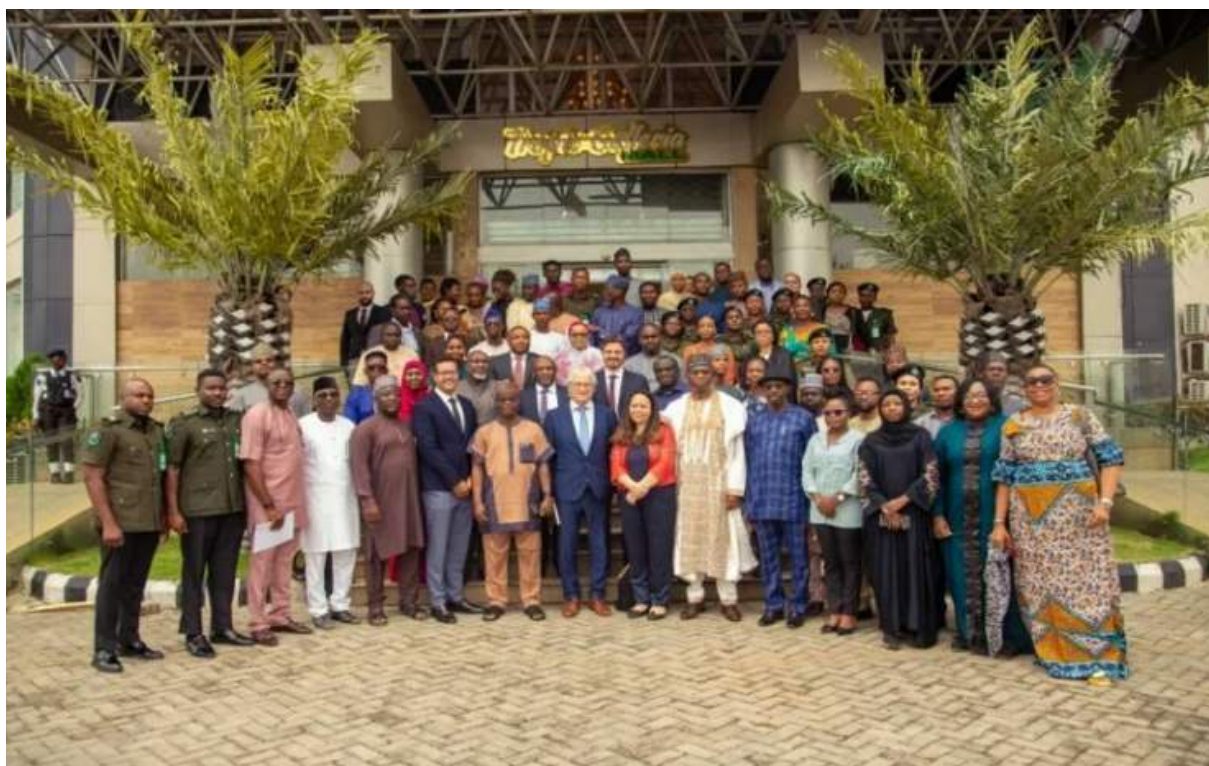
Lancement du système e-Phyto au Nigéria – Abuja, le 25 juin 2024

Renforcer l'interopérabilité entre les systèmes nationaux, répondant ainsi directement à l'un des principaux goulets d'étranglement des flux commerciaux dans la région de l'OCI.