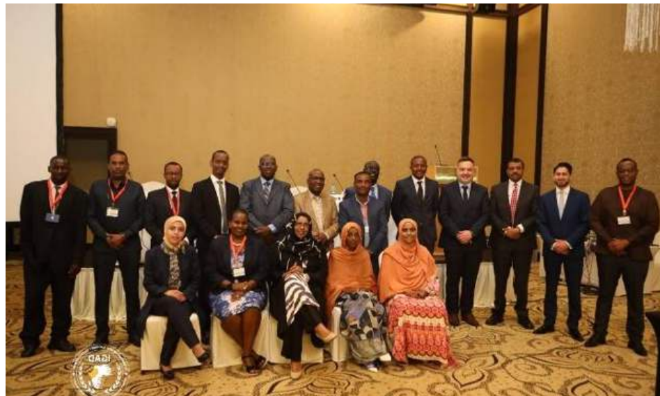
Atelier de formation sur les systèmes TIR/eTIR et CMR/eCMR dans la région de l'IGAD, 1-2 mars 2023 à Djibouti

L'un des développements les plus marquants de ces dernières années réside dans le rôle croissant de la numérisation dans le transport et la facilitation des échanges. Le pas-